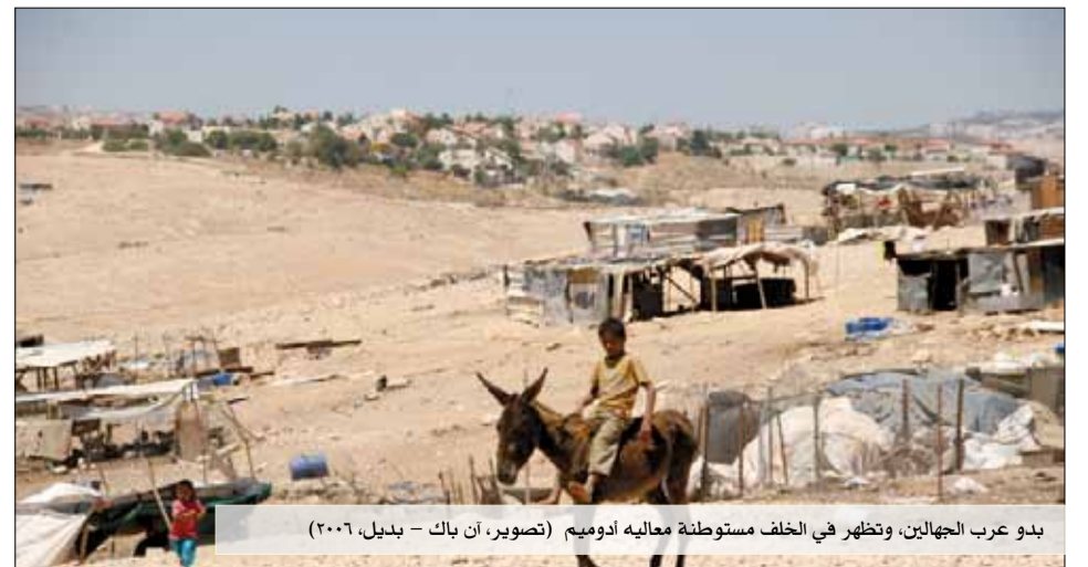
بدو عرب الجهالين، وتظهر في الخلف مستوطنة معاليه أدوميم

تعليق تشارلز كايس: لكن وفقا للدستور الذي تقترحه فإن أراضي سكان المستوطنات ستأخذ منهم وسيعاد تقسيمها مجددا. هذا لن يشجعهم على التعاون.