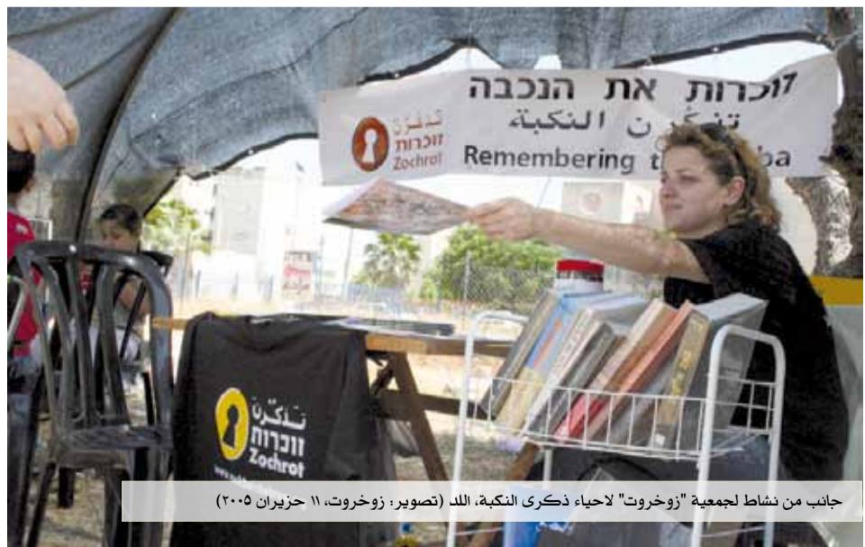
جانب من نشاط لجمعية "زوخروت" لاهياء ذكرى النكبة، اللد (تصوير: زوخروت، ١١ حزيران ٢٠٠٥)

تعليق تومر غوردي: هذه المقولة إشكالية وقابلة للمعارضة والظعن. ما الذي تقولونه؟ دعونا نقوم بتجربة لا ندرك أبعادها ولم نأت على ذكر أخطارها هنا في النص، في حين ان الخطر موجود، وأنه ليس نتاج خيال أناس يخافون فقط؟ وإذا فشلت هذه الفكرة، هل يهرب من هنا أولئك الذين يحملون جوازات سفر أوروبية أو ذوي العلاقات في الجامعات، في البورصات؟ ومن سيدفع الثمن، الناس العالقون هنا؟ هذا يعني عملياً ان هذه التجربة ستكون على حسابهم هم.