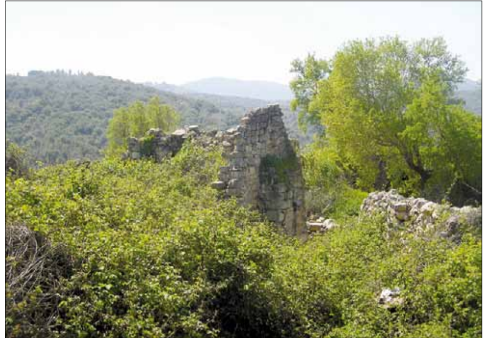
أراضي قرية كفر برعم المهجرة، صفد

تعليق هيلل كوهين: وعلى ماذا؟ على سنوات المعاناة فقط؟