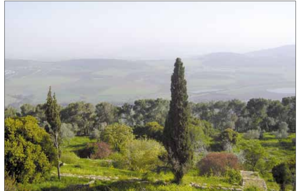
جانب من مرج ابن عامر

٣١ تعليق سامي شطري: بماذا يمكن تشبيه الأمر؟ بسجين محكوم بالسجن المؤبد (دون الحق في الحصول على عفو) يقبع في السجن ويرسم بيت أحلامه. مشير للشقة؟