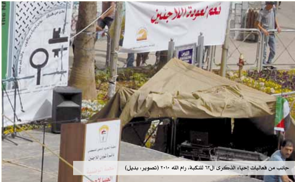
جانب من فعاليات إحياء الذكرى الـ ٦٣ للنكبة، رام الله ٢٠١٠

تطبيق تومر غوردي: أظن أن هناك تناقضا صارخا بين طبيعة الدولة وقوتها في مرحلة الـ «قبل» وبين صورة الدولة في مرحلة الـ «بعد». الدولة في المرحلة الانتقالية حسب رؤيتكم هي دولة قوية ذات حكم مركزي، تنتقل الناس من مكان إلى آخر، تخطط، تحضر؛ بينما في مرحلة «بعد» تصبح الدولة «ضعيفة» أي أنها تتجرد من كافة الصلاحيات المركزية للمرحلة الانتقالية وتختار ضعفها بمحض إرادتها. هذا يبدو غير منطقي بالنسبة لي، لا يلاءم أي شيء أعرفه في السياسة، يبدو أنكم معنيين بعملية تبدأ بشكل حداثي-مركزي، عقلاني، موحد وواقعي- وينتهي بواقع ما بعد حداثي فرداني متعدد الثقافات.