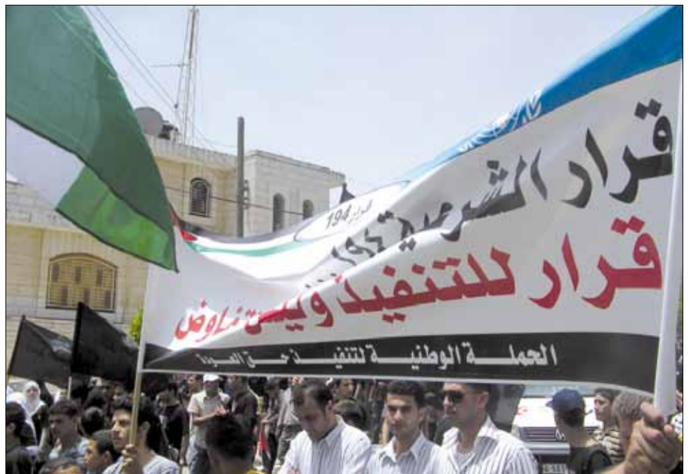
إحياء الذكرى ال-٦٠ للنكبة، رام الله ٢٠٠٨

نتقدم بالشكر لكافة المشاركين والمشاركات في المجموعة وإلى أعضاء "ذاكرات" حيث بمساعدتهم/نا بدأنا التفكير بصوت مرتفع.