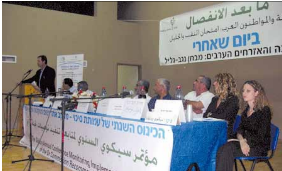
مؤتمر «سيكوي» السنوي لمراقبة تنفيذ توصيات لجنة أور حول مكانة العرب في الداخل، مدينة رهط، النقب، أيلول ٢٠٠٥.