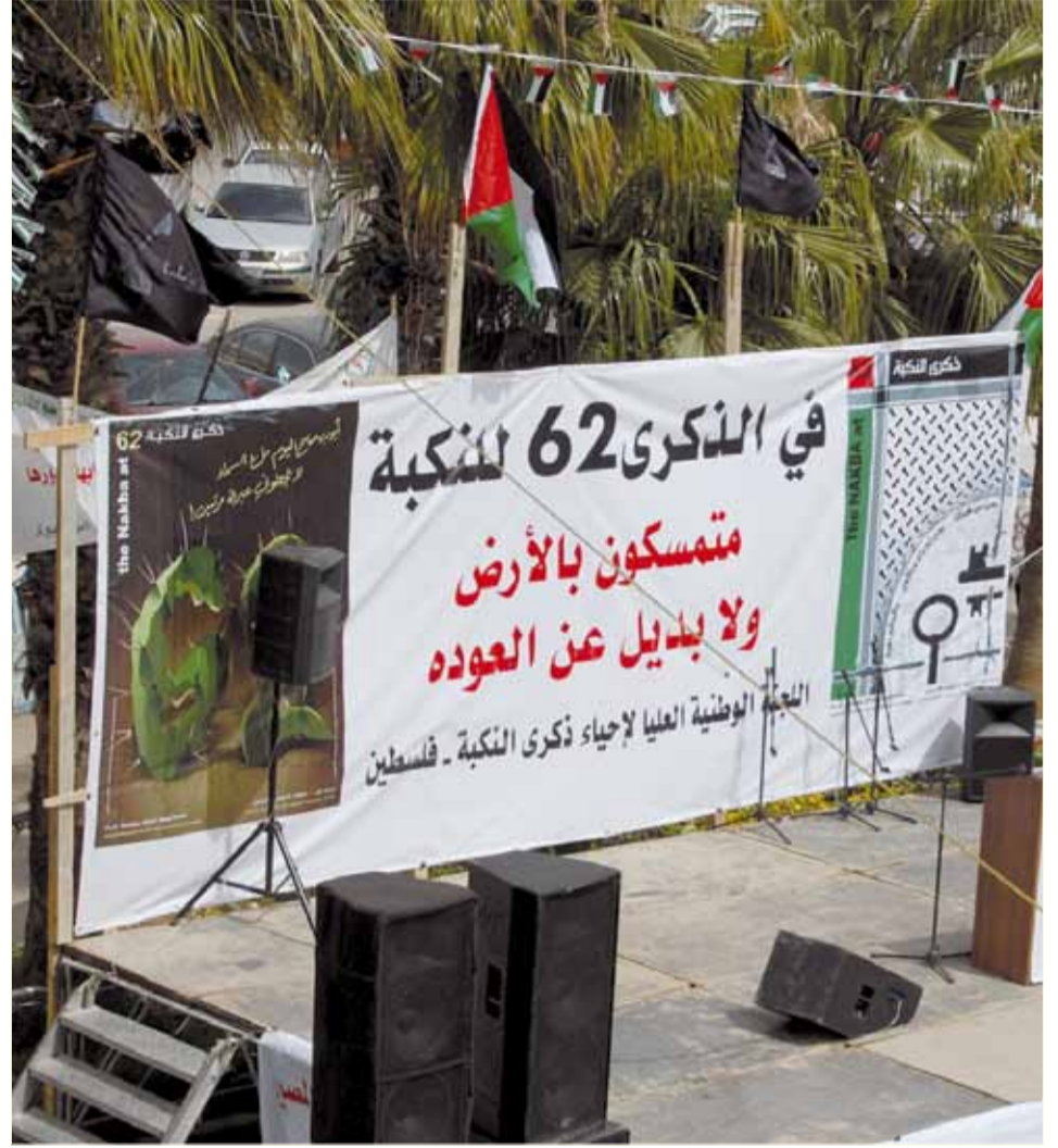
جانب من فعاليات إحياء الذكرى الـ ٦٢ للنكبة، رام الله ٢٠١٠

تعليق يوني أشبار: إن النموذج السياسي الذي بدأنا بوصفه مثير للاهتمام. أنا أشارككم الرأي بالتوجه الفكري الذي يبحث عن نموذج لتوزيع القوة وإعطاء استقلالية قصوى للفرد والجماعة. أنتما تقترحان الفصل بين حكم يتعامل مع الجوانب «الحيادية» للمجتمع (شوارع، إشارات ضوئية، بنى تحتية، إلخ) التي ستديرها هرمية إقليمية من المؤسسات الحكومية (دولة، مجلس محلي، بلدية، لجنة الحي، إلخ) وبين جوانب ذات علاقة بالدين، الثقافة، والهوية التي ستكون تحت نفوذ مؤسسات لا-إقليمية، العضوية فيها تطوعية، أي أن كل مواطن يختار أي سلطة يرغب في الانضمام إليها. هنالك إمكانيات عديدة، لكن العديد من المشاكل أيضا والتي يجب أن ن فكر فيها.