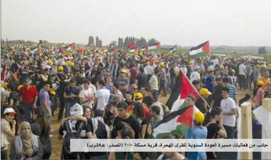
جانب من فعاليات مسيرة العودة السنوية للقرى المهجرة، قرية مسكة ٢٠١٠

إسرائيليون (١) يعيشون هنا، كان حق العودة للاجئين الفلسطينيين دائما بالنسبة لنا (٢) احد أكبر المحرمات